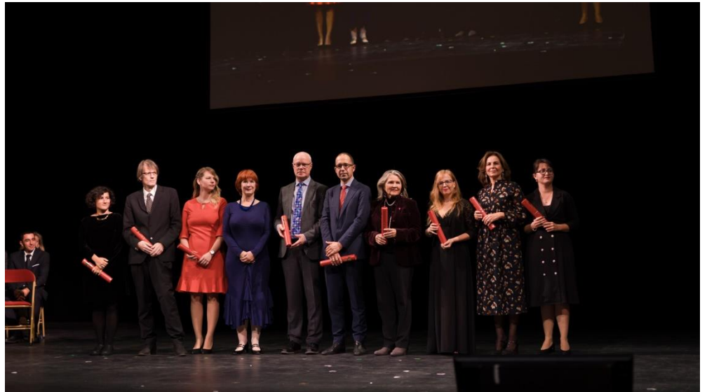
Die Preisträgerin und Preisträger mit den Awards

unmittelbaren Lebensumfeld anhand von Graphic Novels, Zeitreisen und Projektideen spielerisch kennen zu lernen. Sie ist interaktiv und intuitiv aufgebaut, jeder folgt seinen Interessen und lässt sich durch Zeitreisen oder Projektideen leiten. Kulturvermittler sind dazu eingeladen, den „europäischen Code“ unserer Kulturdenkmäler zu entschlüsseln und weiter zu geben.