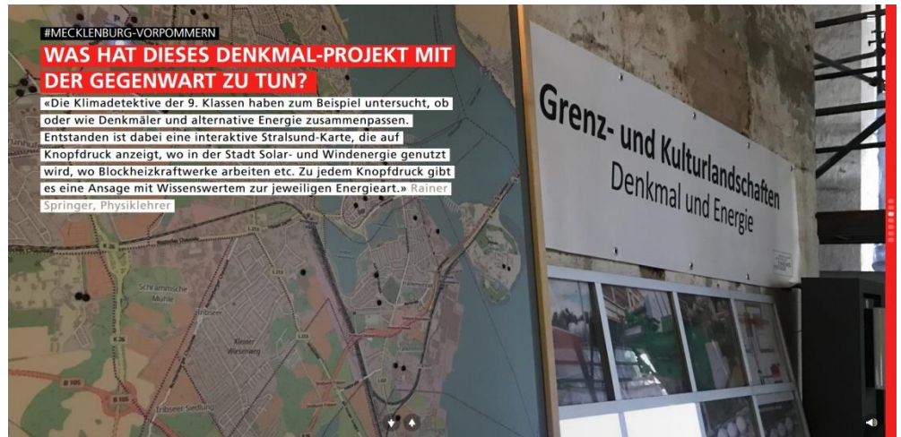
Die Website www.denkmal-europa.de

Für ein bundesweites Echo der digitalen Ausstellung DENKMAL EUROPA sorgte auch schon die Nominierung für den Online Award des Grimme-Institutes. Sowohl der Europa Nostra Award als auch die Grimme Online Award-Nominierung würdigen die Tatsache, dass man sich ohne jedes Vorwissen auf der Seite DENKMAL EUROPA bewegen und sich von ihr inspirieren lassen kann.